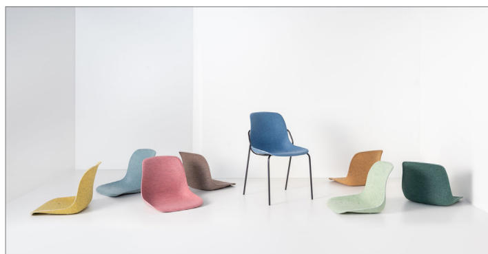
Felt Fine colour - zonder armlegger

De Felt Fine behoort tot de duurzame Felt-familie.