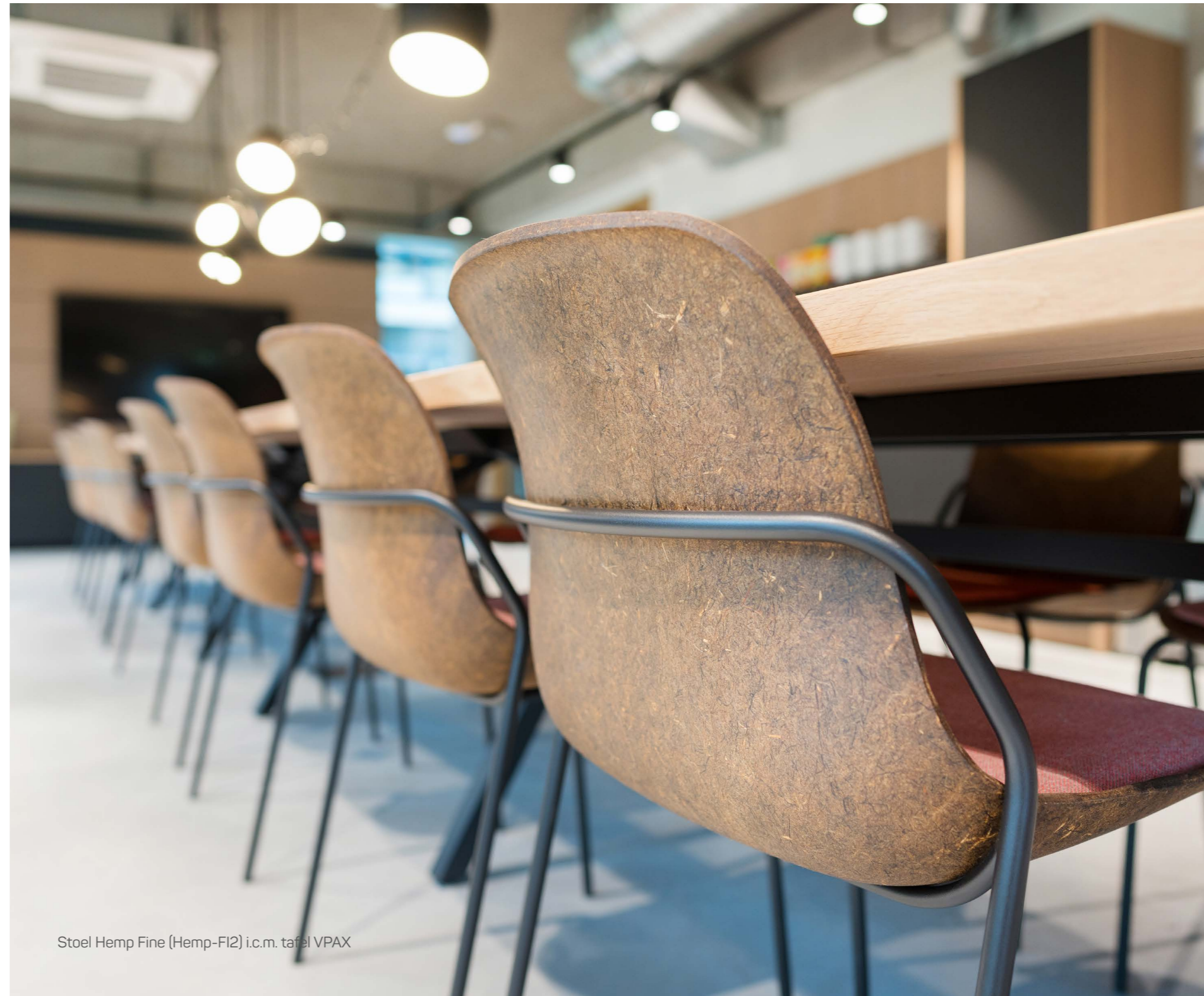
Stoel Hemp Fine (Hemp-FI2) i.c.m. tafel VPAX

Beide internationaal erkende testen heeft de Hemp glansrijk doorstaan!