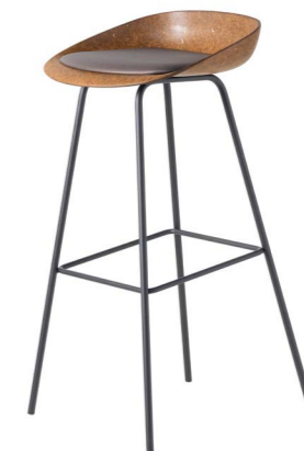
Hemp High met stalen poten en kussen