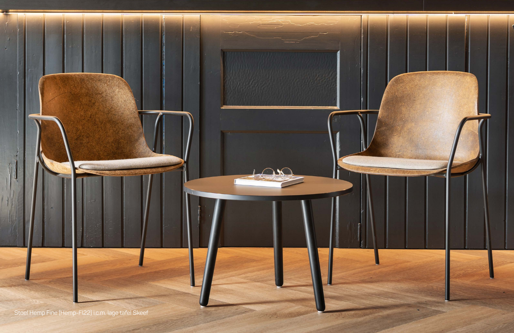
Stoel Hemp Fine (Hemp-F122) i.c.m. lage tafel Skeef