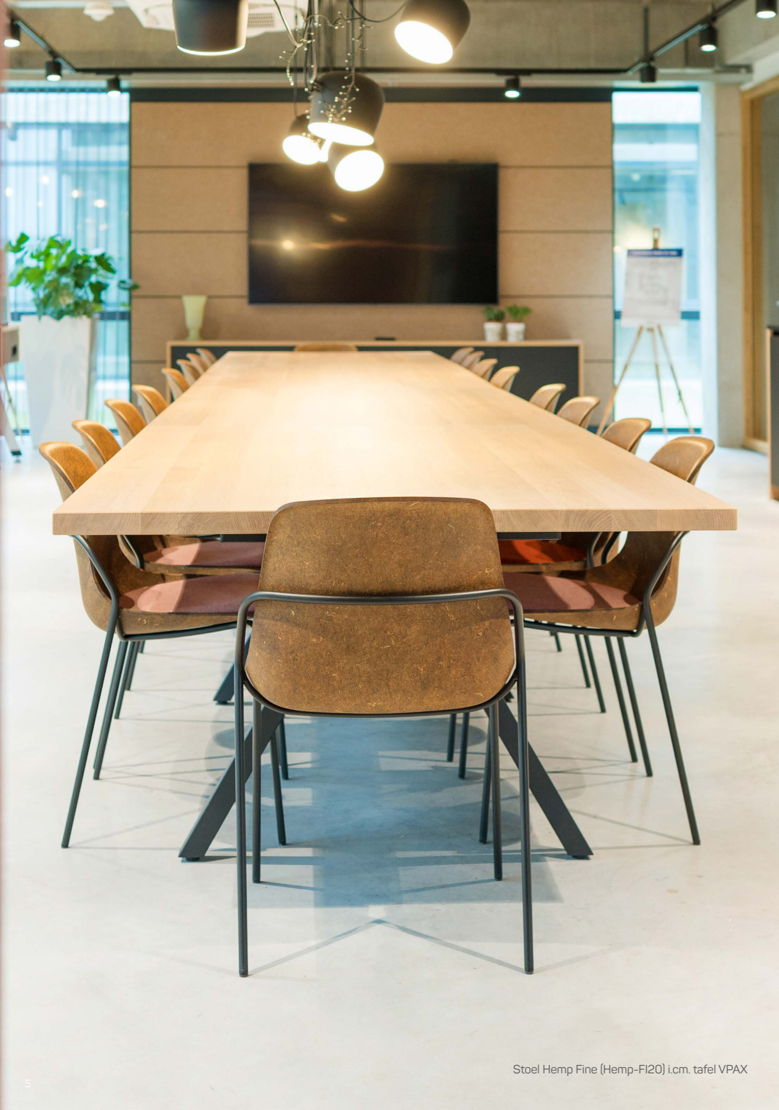
Stoel Hemp Fine (Hemp-FI20) i.cm. tafel VPAX