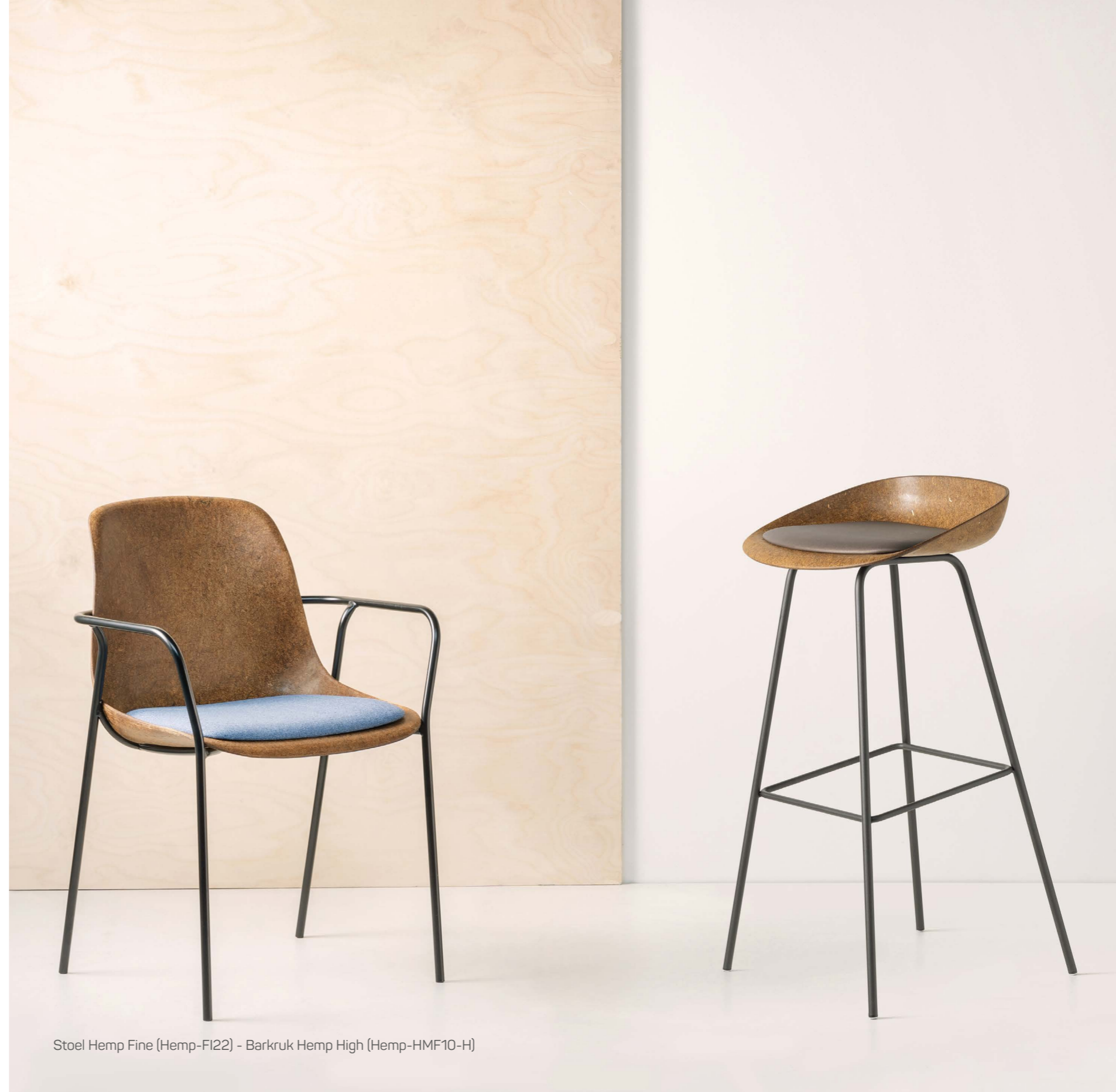
Stoel Hemp Fine (Hemp-FI22) - Barkruk Hemp High (Hemp-HMF10-H)

De onderdelen van de stoel zijn zo ontworpen dat ze na gebruik eenvoudig van elkaar te scheiden zijn en hergebruikt kunnen worden. Hoewel de kuipen in de natuur volledig afbreekbaar zijn, breken we ze liever niet af. Dat is zonde en onnodig. De kuip wordt vermalen en daarna opnieuw geperst. Met dezelfde kwaliteit en eindeloos opnieuw. Wij zijn het enige bedrijf ter wereld waarbij dit mogelijk is zonder dat er nieuwe grondstoffen worden toegevoegd.