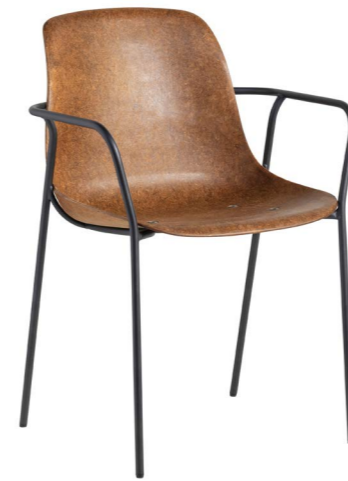
Hemp Fine met armleggers

Onze ambitie om in de toekomst alleen nog maar duurzame circulaire meubels te maken is al meerdere malen uitgesproken en een 100% biologische stoel past hier perfect bij. Met het mooie, natuurlijke materiaal hennep en de biohars – ontwikkeld door Plantics – bleek dit mogelijk. Met de Hemp als resultaat.