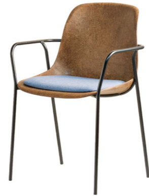
Hemp Fine met armleggers en kussen