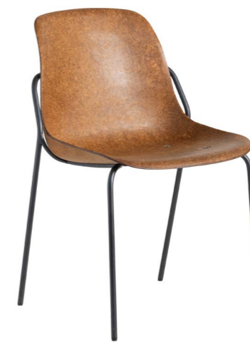
Hemp Fine zonder armleggers