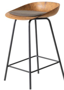
Hemp Medium met armleggers en kussen