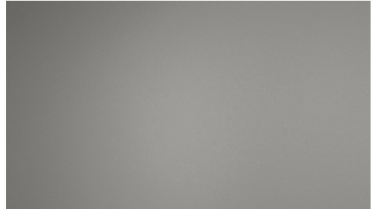
H17 Grey | Gris | Grau